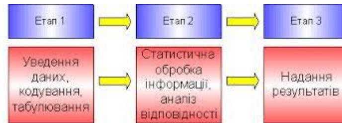
Рис. 2.7. Процес аналізу даних маркетингових досліджень

Здобувач вищої освіти ознайомиться з основними методами обробки та аналізу статистичної інформації, дізнається про методи Стюдента, Фішера та Тьюкі, навчиться використовувати різноманітні статистичні програми, розраховувати основні величини залежностей та кореляцій для встановлення статистичної достовірності даних.