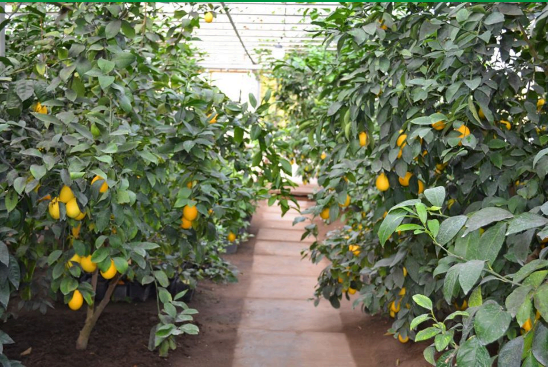
Вирощування цитрусових у теплицях