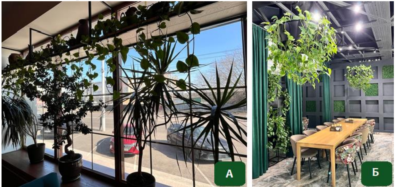
Рисунок 1. Використання елементів біофільного дизайну в інтер'єрах закладів HoReCa м. Кропивницький: А – Ресторан «ChaCha», Б – Ресторан «Arka».

психоемоційний стан відвідувачів. Простір виглядає відкритим та пов'язаним із зовнішнім середовищем.