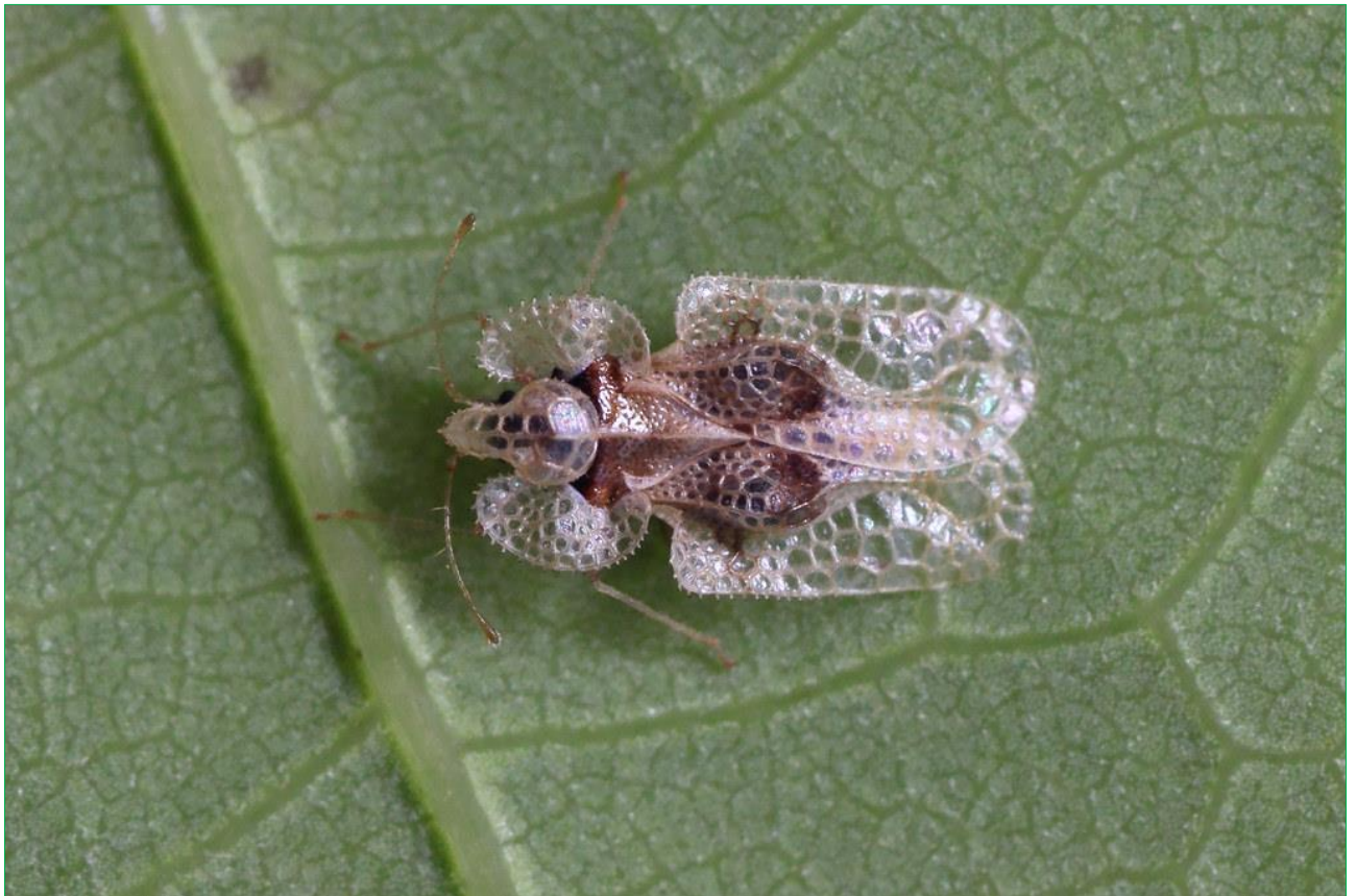
Рис. 1. Клоп-мереживниця дубовий ( Corythucha arcuata SAY.).

Клоп-мереживниця дубовий ( Corythucha arcuata SAY.) (рис. 1) – небезпечний шкідник листяних порід, який пошкоджує різні види дуба: дуб звичайний ( Quercus robur ), дуб скельний ( Quercus petraea ), дуб бургундський ( Quercus cerris ), дуб Фрайнетто ( Quercus frainetto ), дуб пухнастий ( Quercus pubescens ), дуб Гартвіса ( Quercus hartwissiana ), дуб каштанolistий ( Quercus castaneifolia ). Був виявлений крім дуба, також на листі в'язу і білої акації. Однак залишається не ясним, чи здатні вони пройти весь цикл розвитку при харчуванні на цих деревних породах. Відомо також, що клоп може харчуватися на листі каштану посівного, але чи можливим є пошкодження каштану цим шкідником залишається не підтвердженим [1-4].