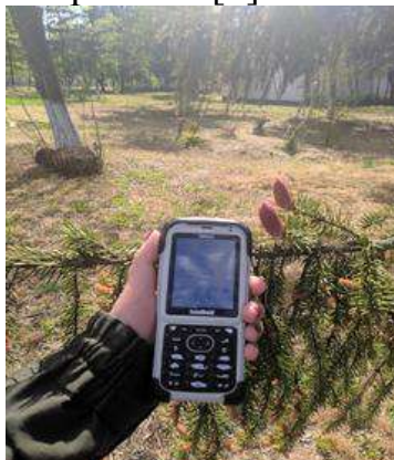
Рисунок. – Загальний вигляд кишенькового персонального комп'ютера

Однією з важливих умов організації електронного обліку лісопродукції своєчасне, якісне і достовірне складання первинної документації по заготівлі, зберігання, реалізації і використанню на власні потреби лісопродукції на всіх стадіях виробництва і місцях зберігання [2].