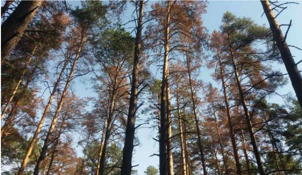
Рисунок 1. Усихання соснових насаджень Волинської області

Збільшення періоду, сприятливого для інтенсивної життєдіяльності ксилофагів (до 7–8 місяців) зумовлене потеплінням, а також наявність великої кормової бази у вигляді ослаблених і розладнаних деревостанів стимулює подальше значне наростання їх чисельності. Верхівковий короїд утворює за вегетаційний період уже не два повноцінні покоління, а три. У місцях масової концентрації стовбурових шкідників підвищується ймовірність їх нападу й на відносно здорові дерева. Тому окремі види ксилофагів (у нашому випадку короїд вершинний) у місцях їх високої концентрації (гострих спалахів) за шкодочинністю набувають ролі та значення первинних шкідників. Коли ксилофаги набувають ролі та значення первинних шкідників, деревостан в осередках патологій уражується суцільно в т.ч. і зовні життєздатні дерева.