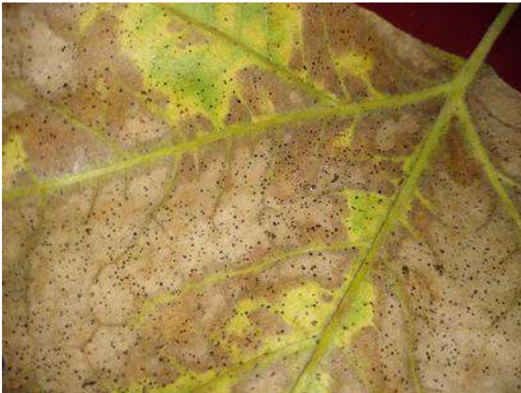
Рисунок 1. Лист Platanus orientalis L., наслідки живлення імаго та німф Corythucha ciliata Say .

Імаго та німфи живляться на нижній стороні листка, скупчуючись поблизу центральної жилки та висмоктують соки. На заселених листках з'являються білясті плями, згодом виникає хлороз листя. Відбувається забруднення листя продуктами життєдіяльності імаго та німф клопа, що може суттєво зменшити фотосинтетичну поверхню (Рис. 1).