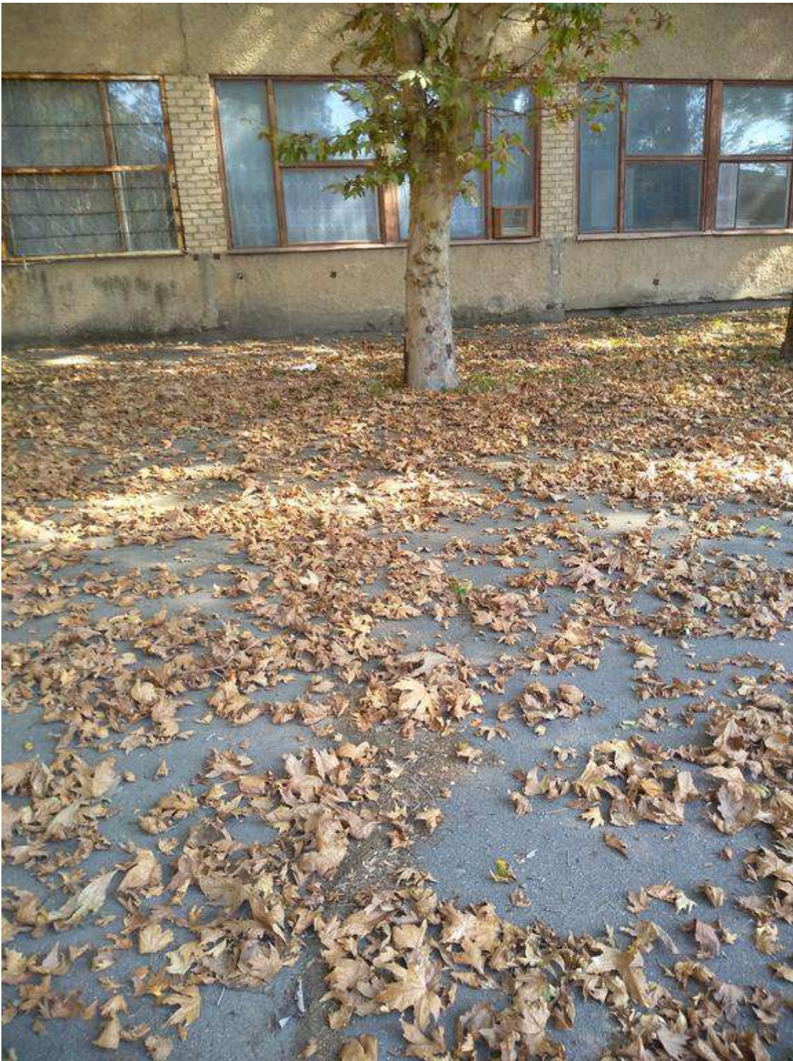
Рисунок 2. Передчасне опадання листя Platanus orientalis L. на території ДВНЗ “Херсонський державний аграрно-економічний університет” (29.08.2019)

Отже, біологічні особливості платанового клопа-мереживниці такі, що цей шкідник зможе на території України заселити всі території, де зростає платан. І хоча платан не входить до складу лісових порід, він залишається однією з найважливіших порід в озелененні населених пунктів, оскільки виконує найважливіші функції оздоровлення міського середовища, слугує