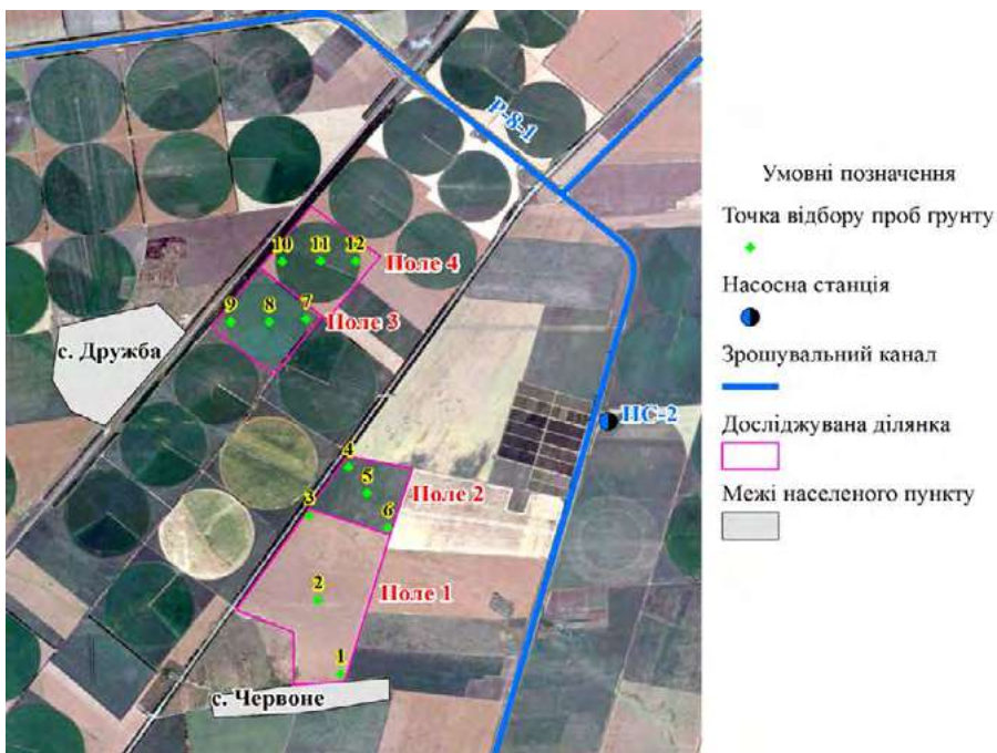
Рис. 1. Карта-схема розташування моніторингової мережі на досліджуваних ділянках ТОВ «Агролюкс» Якимівського району Запорізької області

Землі ТОВ «Агролюкс» розташовані в межах степової зони на Причорноморській низовині на території Каховської зрошувальної системи. Полив проводиться способом дощування. Згідно з ДСТУ 2730:2015, поливна вода обмежено придатна