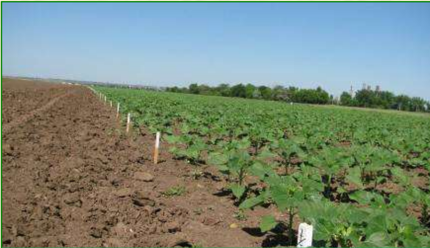
Сортовипробувальна ділянка сортів та гібридів соняшнику