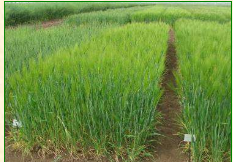
Сортовипробувальна ділянка ярого ячменю