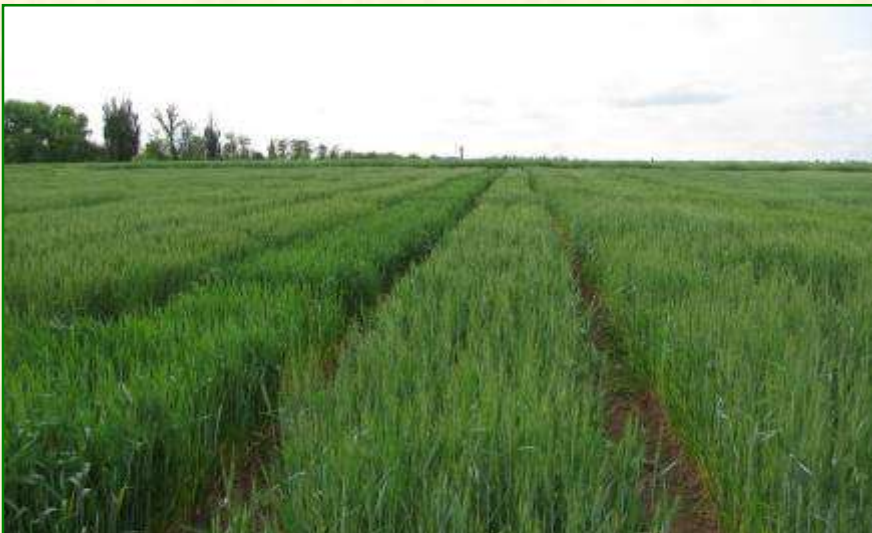
Сортовипробувальна ділянка озимої пшениці