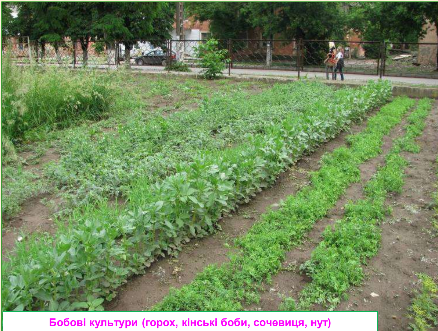
Бобові культури (горох, кінські боби, сочевиця, нут)