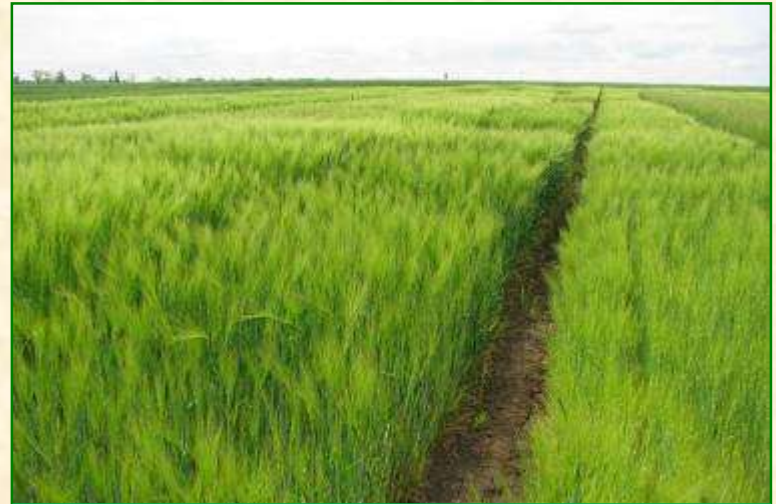
Сортовипробувальна ділянка озимого ячменю