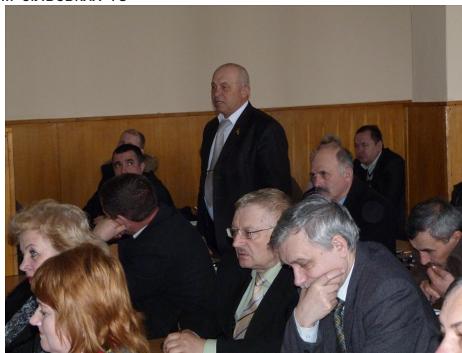
Науково-педагогічні працівники ХДАУ прийняли активну участь у роботі семінару