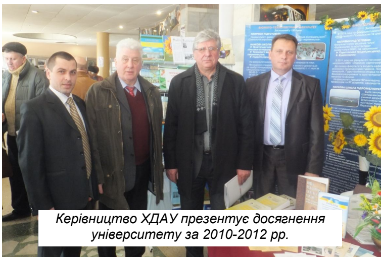
Керівництво ХДАУ презентує досягнення університету за 2010-2012 рр.

Виставку відвідав заступник голови Херсонської облдержад-